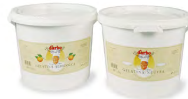
Peso netto 13,3 kg - 44 secchi per pallet GELATINA A CALDO NEUTRA - ALBICOCCA