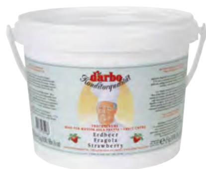
Peso netto 4,5 Kg - 90 secchi per pallet FRAGOLA, LAMPONE, ALBICOCCA, MIRTILLI NERI